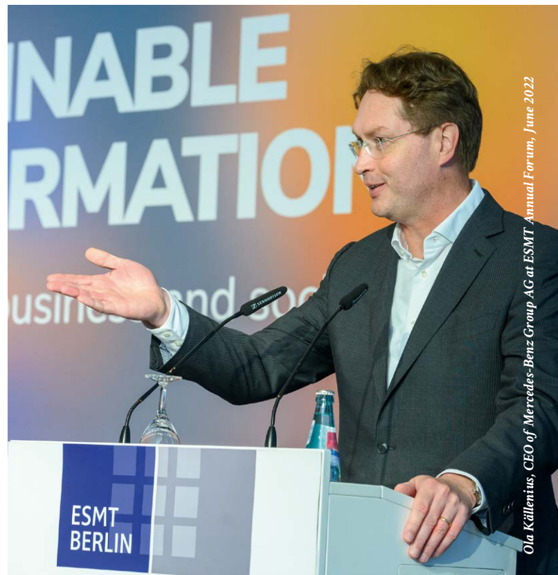
Ola Källenius, CEO of Mercedes-Benz Group AG at ESMT Annual Forum, June 2022