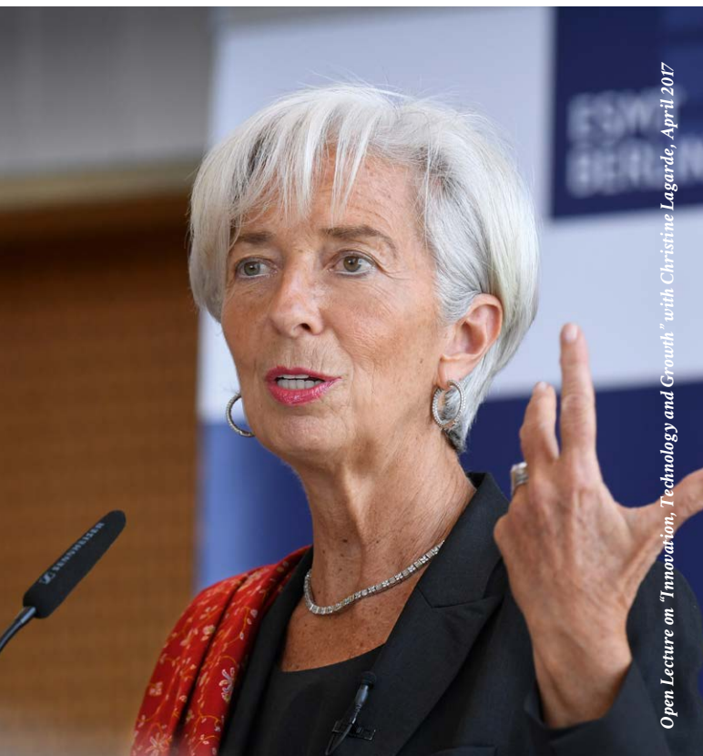
Open Lecture on "Innovation, Technology and Growth" with Christine Lagarde, April 2017